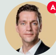
Kaare Dybvad Udlændinge- og integrationsminister