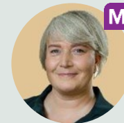
Christina Egelund Uddannelses- og forskningsminister