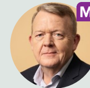
Lars Løkke Rasmussen Udenrigsminister