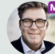
Lars Aagaard Klima-, Energi- og Forsyningsminister