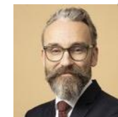
Ole Birk Olesen