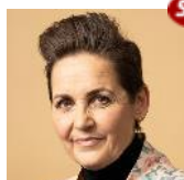
Pia Olsen Dyhr