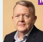
Lars Løkke Rasmussen