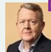
Lars Løkke Rasmussen