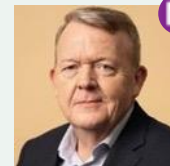
Lars Løkke Rasmussen