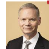
Jens Kristian Thulesen Dahl