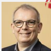
Hans Kristian Skibby