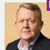
Lars Løkke Rasmussen