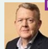
Lars Løkke Rasmussen