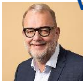
Lars Christian Lilleholt