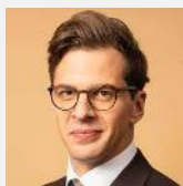
Alex Vanopslagh Formand for LA