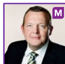
Lars Løkke Rasmussen Udenrigsminister