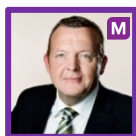
Lars Løkke Rasmussen Udenrigsminister