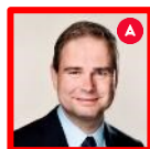
Nicolai Wammen Finansminister (Formand)