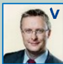
Jacob Jensen Minister for fødevarer, landbrug og fiskeri