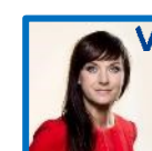
Sophie Løhde Indenrigs- og sundhedsminister