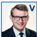
Troels Lund Poulsen Vicestatsminister og forsvarsminister