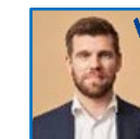
Morten Dahlin Minister for byer og landdistrikter, kirke- minister og minister for nordisk samarbejde