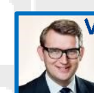
Troels Lund Poulsen Vicestatsminister og Forsvarsminister