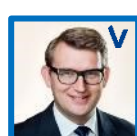
Troels Lund Poulsen Vicestatsminister og Forsvarsminister