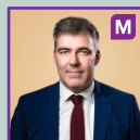
Lars Aagaard Klima-, energi- & forsynings-minister