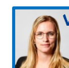
Stephanie Lose Økonomiminister