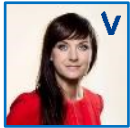
Sophie Løhde Indenrigs- og sundheds- minister