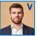
Morten Dahlin Minister for byer og landdistrikter, kirke- minister og minister for nordisk samarbejde