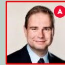
Nicolai Wammen Finansminister (Formand ØU og GU)