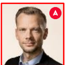
Peter Hummelgaard Justitsminister