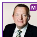
Lars Løkke Rasmussen Udenrigsminister