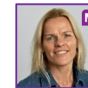
Mette Kiergaard Ældreminister