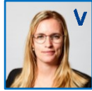
Stephanie Lose Økonomiminister