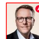
Morten Bødskov Erhvervsminister