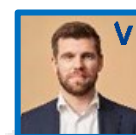
Morten Dahlin Minister for byer og landdistrikter, kirke- minister og minister for nordisk samarbejde