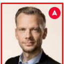
Peter Hummelgaard Justitsminister