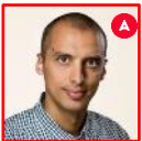
Mattias Tesfaye Børne- og undervisningsminister