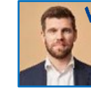
Morten Dahlin Minister for byer og landdistrikter, kirke- minister og minister for nordisk samarbejde