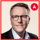
Morten Bødskov Erhvervsminister