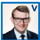
Troels Lund Poulsen Vicestatsminister og forsvarsminister