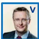
Jacob Jensen Minister for fødevarer, landbrug og fiskeri