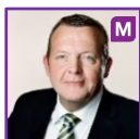
Lars Løkke Rasmussen Udenrigsminister