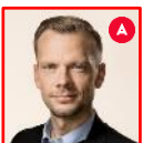
Peter Hummelgaard Justitsminister