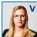
Stephanie Lose Økonomiminister