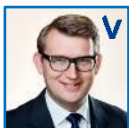
Troels Lund Poulsen Vicestatsminister og forsvarsminister