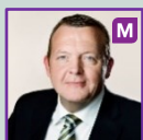
Lars Løkke Rasmussen Udenrigsminister