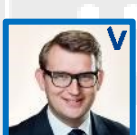
Troels Lund Poulsen Vicestatsminister, Forsvarsminister og økonomiminister