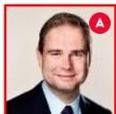
Nicolai Wammen Finansminister