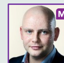
Jakob Engell-Schmidt Kulturminister