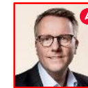
Morten Bødskov Erhvervsminister