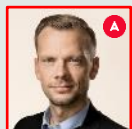
Peter Hummelgaard Justitsminister