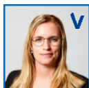
Stephanie Lose Økonomiminister