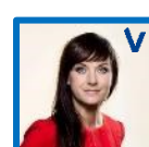
Sophie Løhde Indenrigs- og sundhedsminister