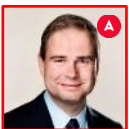
Nicolai Wammen Finansminister