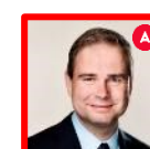
Nicolai Wammen Finansminister