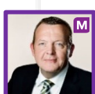
Lars Løkke Rasmussen Udenrigsminister