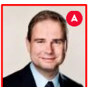
Nicolai Wammen Finansminister