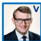
Troels Lund Poulsen Vicestatsminister og forsvarsminister