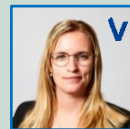
Stephanie Lose Økonomiminister