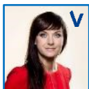
Sophie Løhde Indenrigs- og sundheds- minister