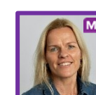
Mette Kierkgard Ældreminister