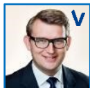
Troels Lund Poulsen Vicestatsminister og forsvarsminister