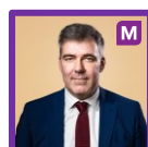
Lars Aagaard Klima-, energi- & forsyningsminister