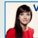
Sophie Løhde Indenrigs- og sundheds- minister