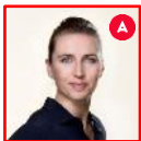
Mette Frederiksen Statsminister