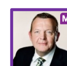
Lars Løkke Rasmussen Udenrigsminister