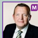
Lars Løkke Rasmussen Udenrigsminister