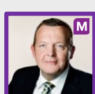
Lars Løkke Rasmussen Udenrigsminister