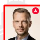
Peter Hummelgaard Justitsminister