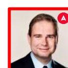
Nicolai Wammen Finansminister (Formand)