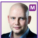
Jakob Engell-Schmidt Kulturminister