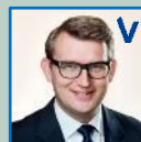
Troels Lund Poulsen Vicestatsminister og Forsvarsminister