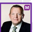
Lars Løkke Rasmussen Udenrigsminister