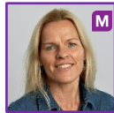
Mette Kiergaard Ældreminister