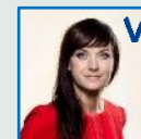
Sophie Løhde Indenrigs- og sundheds- minister