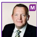
Lars Løkke Rasmussen Udenrigsminister