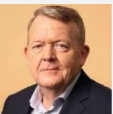
Lars Løkke Rasmussen Formand