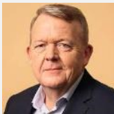
Lars Løkke Rasmussen