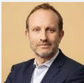
Martin Lidegaard Politisk leder og gruppeformand