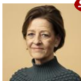
Kirsten Normann Andersen