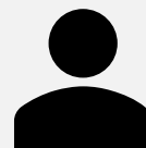
Kollektiv ledelse (SUF)